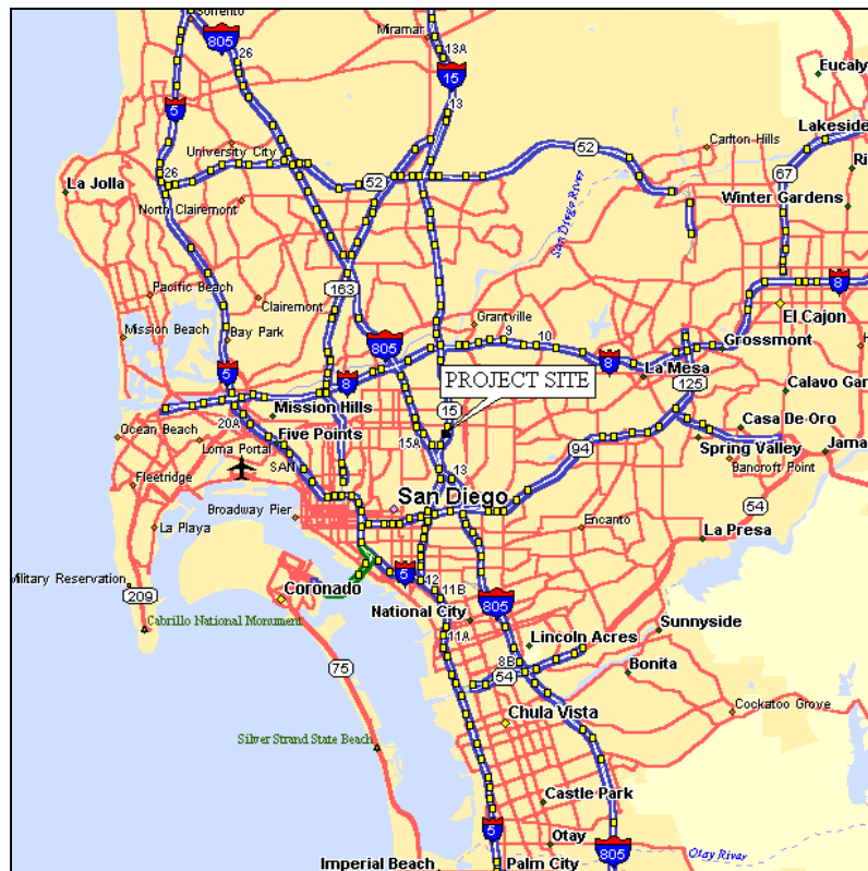
Muestra 1: Ubicación Regional del Proyecto

La Escuela Elemental Area Central será construida en el vecindario de City Heights de la Ciudad de San Diego. La Comunidad de City Heights esta localizada a menos de una milla de distancia de ambas carreteras, Interestatales 805 y 15 y, aproximadamente 5 millas al noroeste del centro de San Diego. (Ver Muestras 1 y 2).